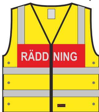
Klassisk Manskapsväst - Modell 227 RAD