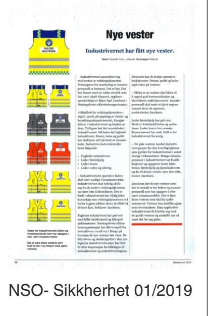
NSO- Sikkerhet 01/2019