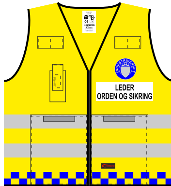
Leder Orden og Sikring