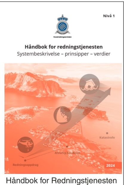
Håndbok for Redningstjenesten

Refleksvester er personlig verneutstyr (PVU) og må derfor være CE merket for å følge kravene om arbeidsgivers plikt for å ivareta personalets sikkerhet på arbeidsplass. Aktuell produktstandard er EN ISO 20471 som er delt opp i klasse 1, 2 eller 3 der synbart areale av godkjent refleks og fluoriserende bakgrunnsmaterialer som sammen med designkrav utgjør forskjellene på klassene imellom. Produsent har også mulighet til å CE merke et plagg etter PPE forordning 425/2016. Arbeidsgiver må i en helhetlig risikoevaluering avgjøre hvilket produkt som best passer en framtidig aktuell situasjon.