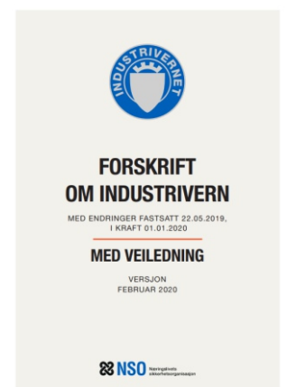
Forskrift om Industrivernet